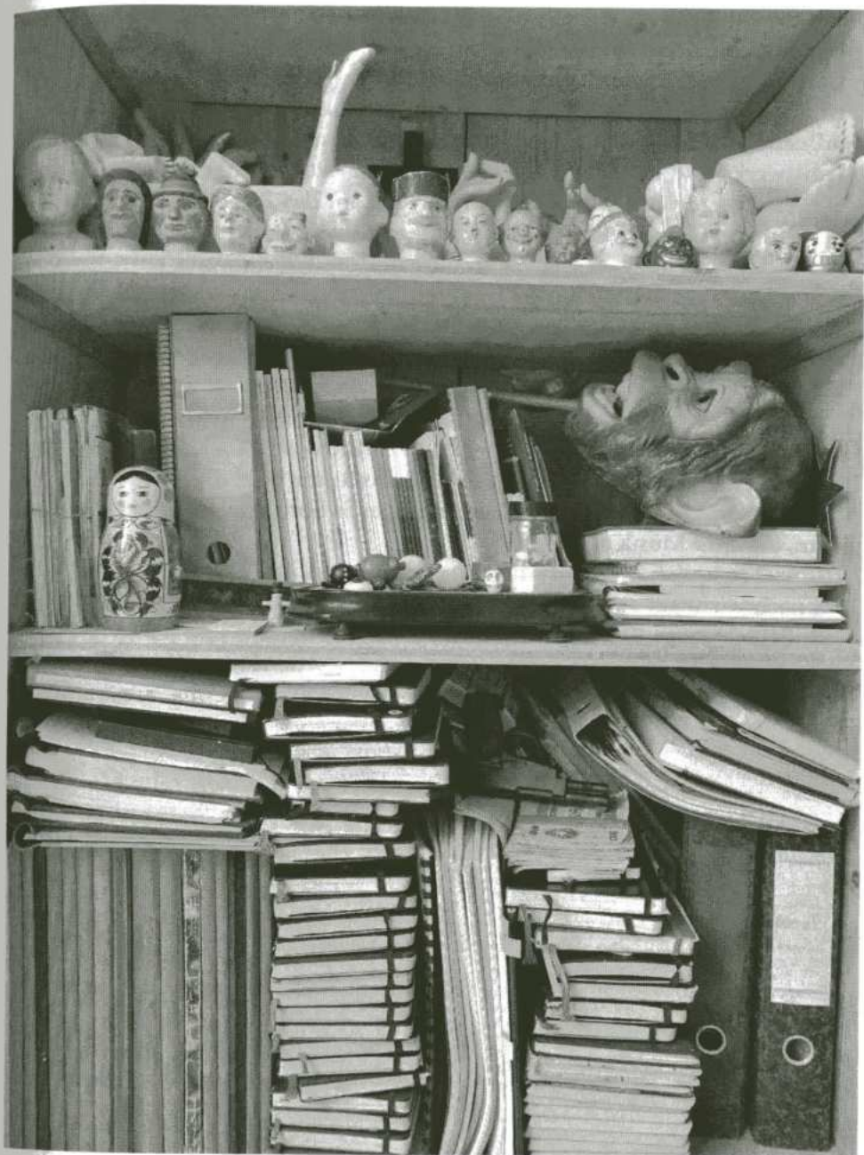
Theaterkasten von Kristine Tornquist